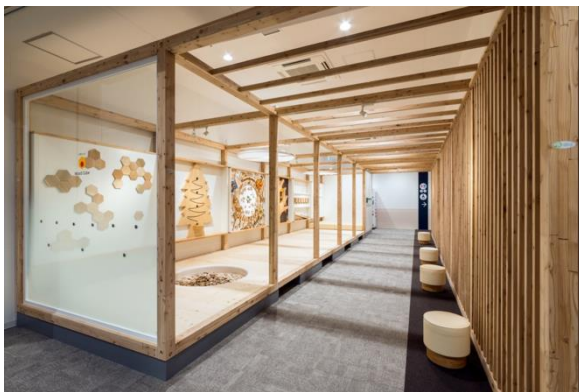
「ららぽーと海老名」でのモニター施工事例

※三井不動産株式会社、NPO法人 日本グッド・トイ委員会（東京おもちゃ美術館）、パワープレイス株式会社との共同受賞です。