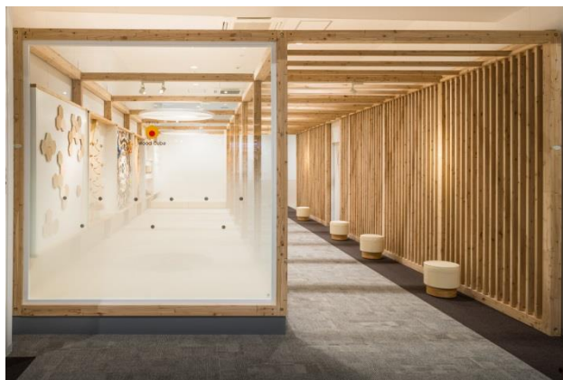
「ららぽーと海老名」キッズプレイエリアでのモニター施工事例

2010年10月に「公共建築物木材利用促進法」が施行されて以降、国産木材・地域木材の利用促進の機運が高まり、これらを利用した新規事業や建築物の内装木質化の取り組みが活発化しています。一方で、国産木材・地域木材の活用にあたっては、産地指定材の調達方法や品質の安定性などの課題があり、事業者が採用を検討する際のハードルとなっている場合がありますことから、さらなる利用を促すためには、より身近で利用しやすい製品や仕組みを提供することが求められています。