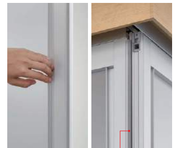
手がかりの良い 通し引手

通し引手になっているので、どの位置でもラクに開閉できます。 ラクラクローズ機能付きで、子どもの指挟みにも配慮しています。