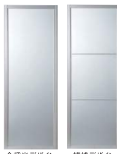
全採光デザイン 横棧デザイン