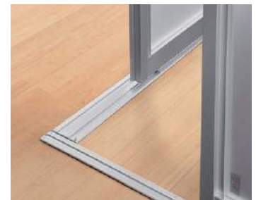
床台下レールの納まり(シルバー)

通し引手になっているので、どの位置でもラクに開閉できます。 ラクラクローズ機能付きで、子どもの指挟みにも配慮しています。