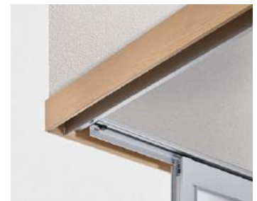
上レールの納まり(シルバー)